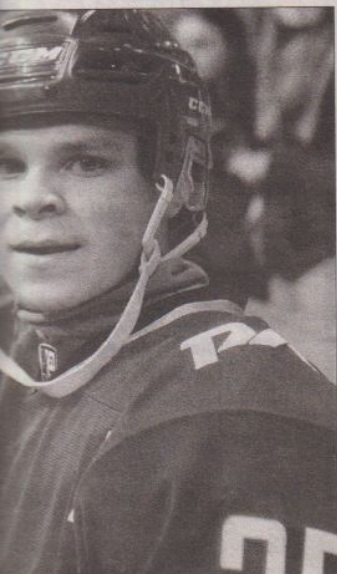
Вышел на лед с «Русским танком».

Для семьи начались не легкие времена, заботы пришлось полностью взять на себя отцу: тут и дочь в школу собрать, и сыновей отвести в детский сад, а младшего – с запасом памперсов и смеси – приходилось брать на службу