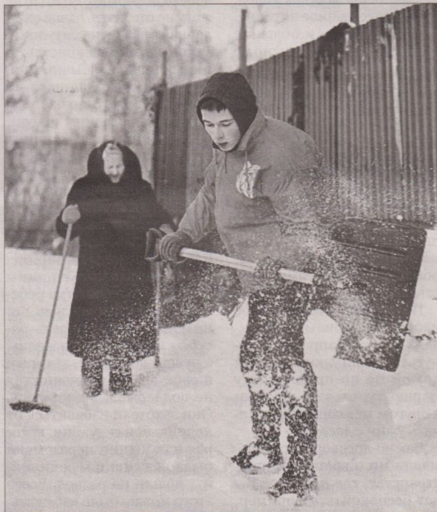
Молодежь активно включилась в акцию помощи пожилым людям.

Изменить мир в лучшую сторону, стать опорой и поддержкой для тех, кто в этом нуждается, быть рядом в нужное время – это может быть и про вас. Из таких дел, из работы, которую, может быть, никто посторонний и не видит, складываются характеры, вырастают люди, которые не просто хотят, но и могут создавать мир, наполненный добром. <<