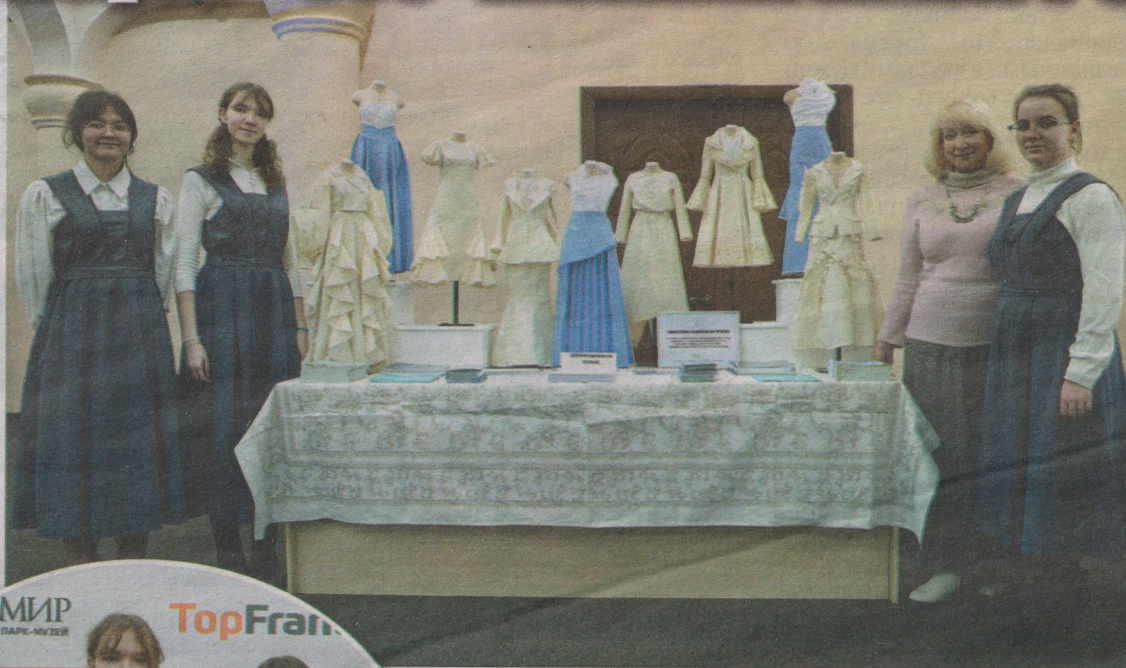
Студентки швейной специальности колледжа представили выставку макетов своих изделий на масштабных манекенах.

На конференции студентки швейной специальности кол-