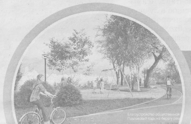
Благоустройство общественной Павловский парк на берегу реки

Новые подходы к благоустройству предлагают молодые архитекторы.