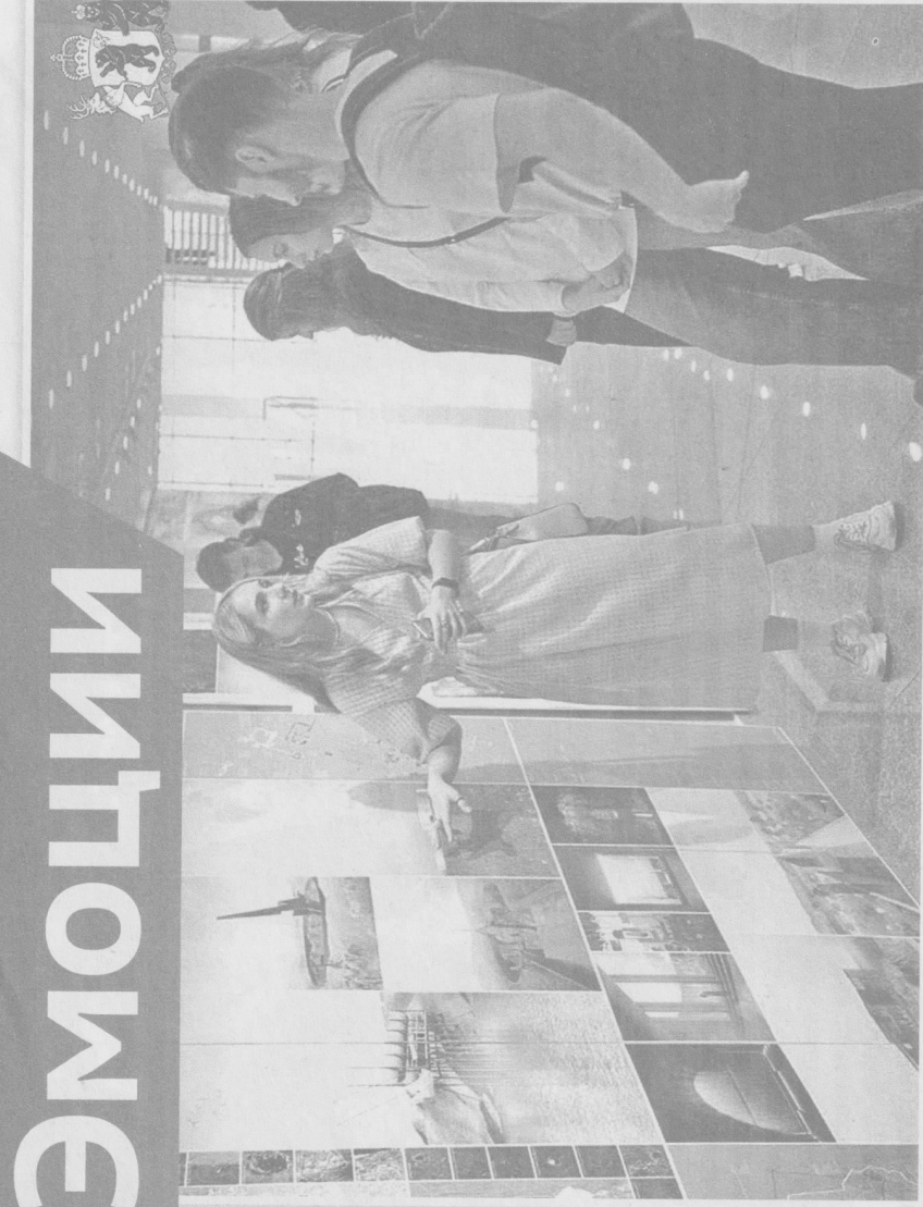
Проекты выпускников ЯГТУ украсили выставку.