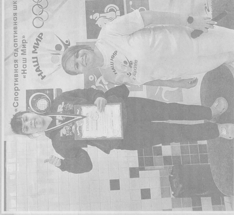
Анатолий КОНОПЦ

Второе важное обстоятельство – она так же отно-