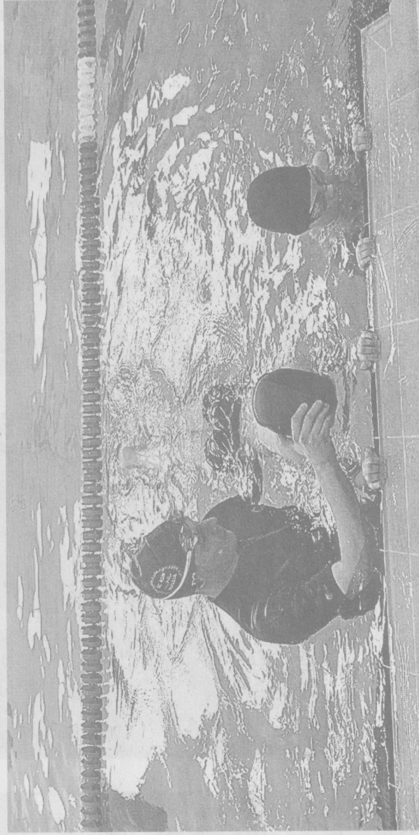
Идет процесс обучения плаванию.