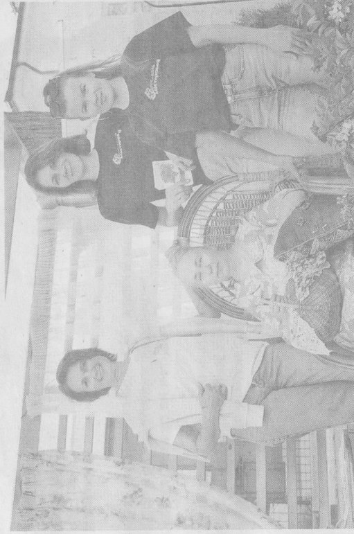
Команда проекта «Строим зеленый каркас Ярославля вместе».

— Мы организуем конкурс «Ярославль в цвету» — городское соревнование активистов-озеленителей. Первый раз он состоялся в 2002 году и с тех пор стал ежегодным, а сейчас уже, без преувеличения