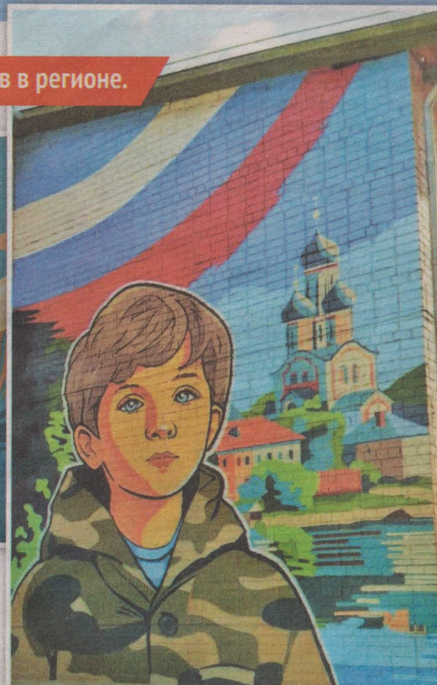
Ольга ПЕТРЯКОВА.