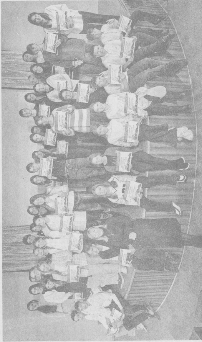
↓ Подведение итогов открытого городского конкурса «Война.Победа.Память».

Состоялось подведение итогов и награждение победителей открытого городского конкурса «Война.Победа.Память», посвященного 80-летию Победы в Великой Отечественной войне, которое наша страна будет отмечать в следующем, 2025 году.