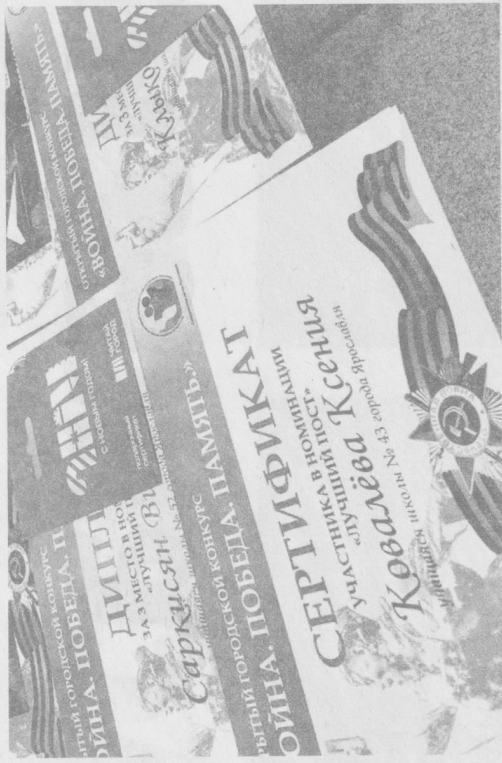
↓ Все участники конкурса получили призы и сертификаты.

будущего. Мы должны помнить тех, благодаря кому живем под мирным небом, – отметила на церемонии награждения победителей директор Института развития