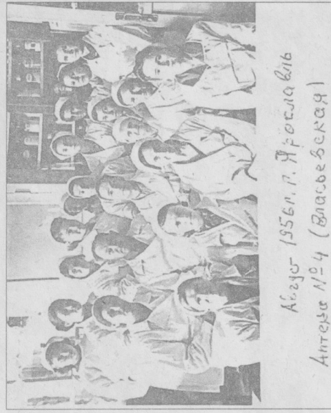
Сотрудники аптеки №4 (Власьевской) 1956 год — фото из поста Данила Назарова.