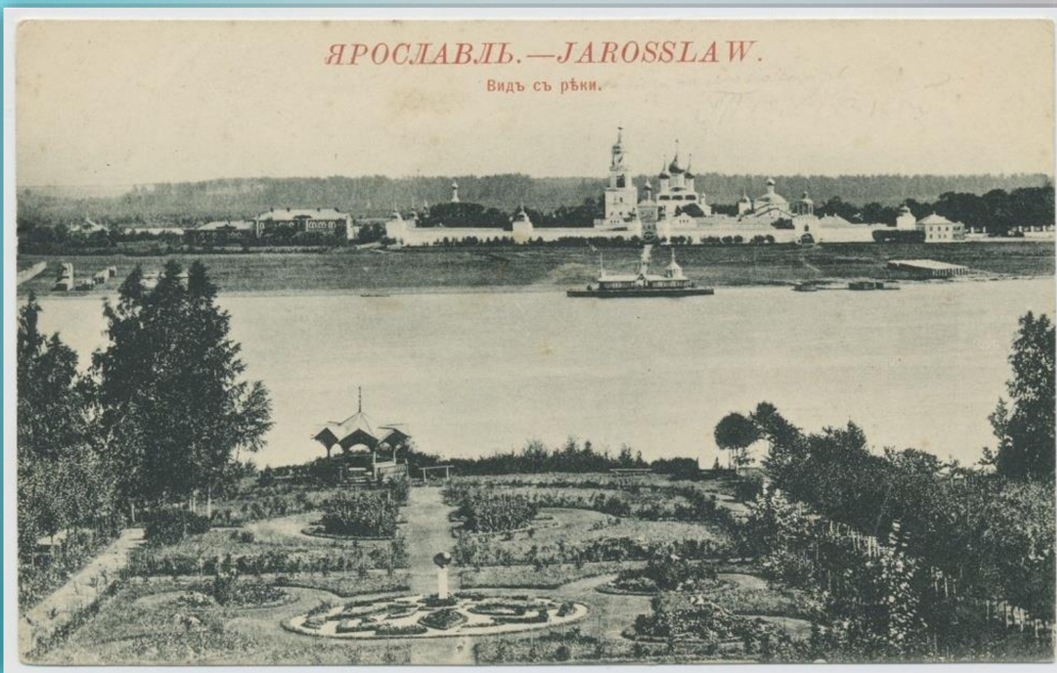
Парк на даче Н.Н. Вахромеева в Павловском. На противоположном берегу Волги - Толгский монастырь